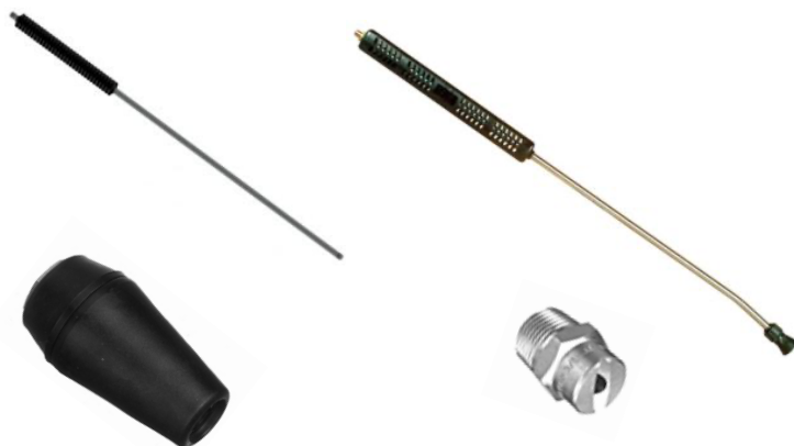
Lanze mit gespritztem Griff und Turbodüse