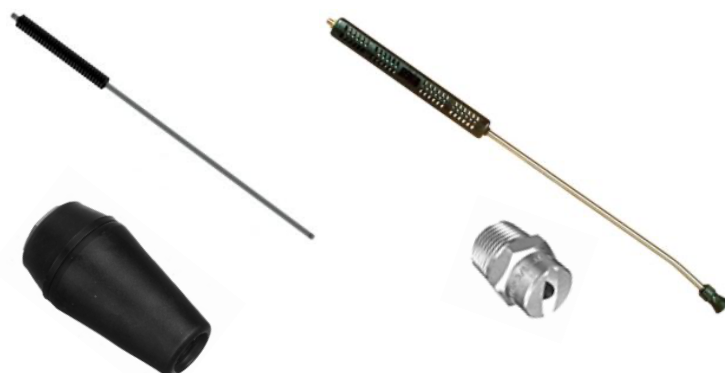
Lance avec poignée injectée et buse rotative