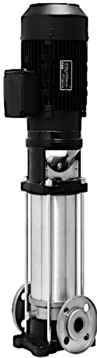
EV15 + 20