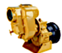
Getriebe / Zapfwelle