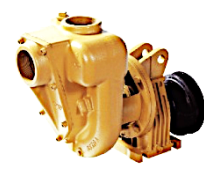
Getriebe / Zapfwelle