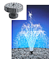
DAISY SUPER 3 STAGES