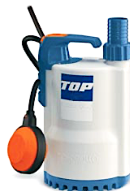
Technopolymer Top 1,2,3