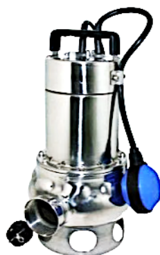
Edelstahl AISI 316 Arvex 100