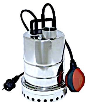
Edelstahl AISI 316 Mizar 60